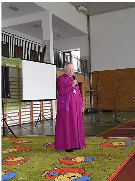
Wizyta księdza biskupa Adama Szala w naszej szkole